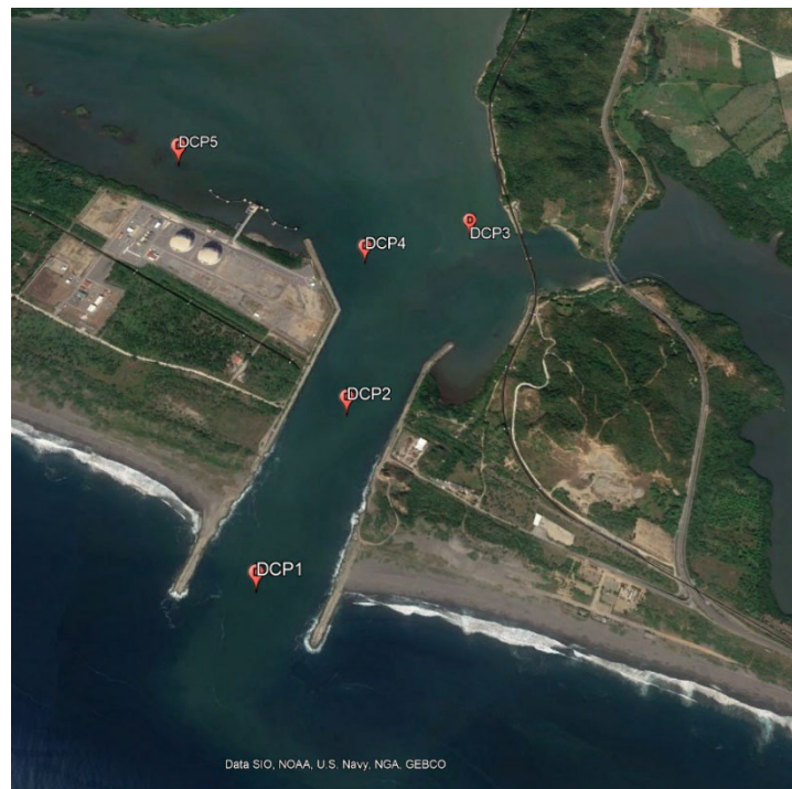
Fig. 2 Mapa de ubicación de puntos de muestreo en Google Earth, para la toma de sedimentos en Puerto Manzanillo Cuyutlán